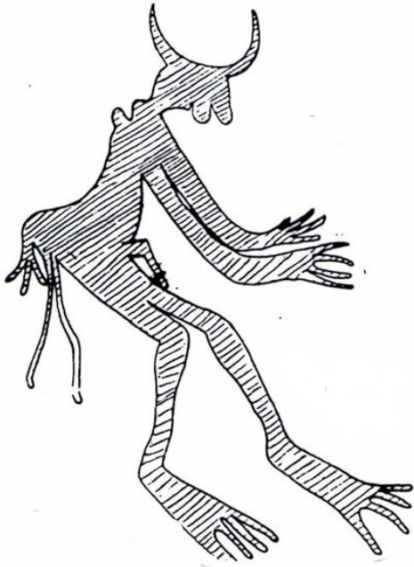
Dessin Charles Brenans

"Charles BRENANS, découvreur des gravures et peintures de la Tassili, et ses carnets de relevés" en parallèle avec les photos de Bernard FOUILLEUX.